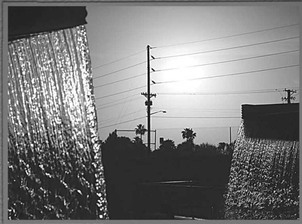
Cascadas históricas de SRP de Arizona